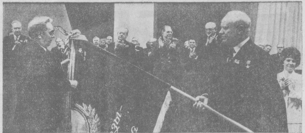
Генеральный секретарь ЦК КПСС товарищ Л. И. Брежнев прикрепляет орден Октябрьской Революции к знамени ВЦСПС.

№ 67 (18344) • Среда, 23 марта 1977 года • Цена 2 коп.