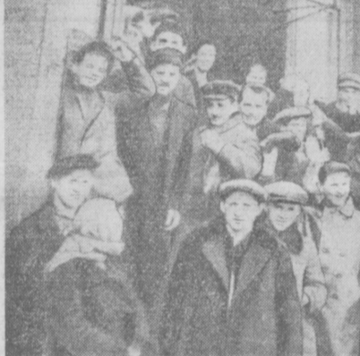
Из фотодокументов тех лет. Преем московских текстильщиц в Ташкент. Их цели: подготовить местные кадры для бурно развивающейся

«История кишлака Гувалдан. Преемство лет назад на месте кишлака Гувалдан было голое место. Лишь около заросшего травой родника чернела мазанка. Здесь жил драгый старик по прозвищу Соттисувчи, что означало «продавец воды». И нему частенько загляды-