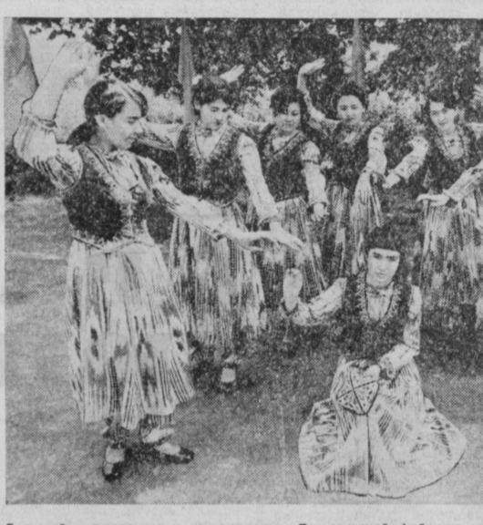
Большой популярностью у коллектива Ташкентской фабрики художественных изделий пользуется тацевальный ансамбль «Созвездие»...