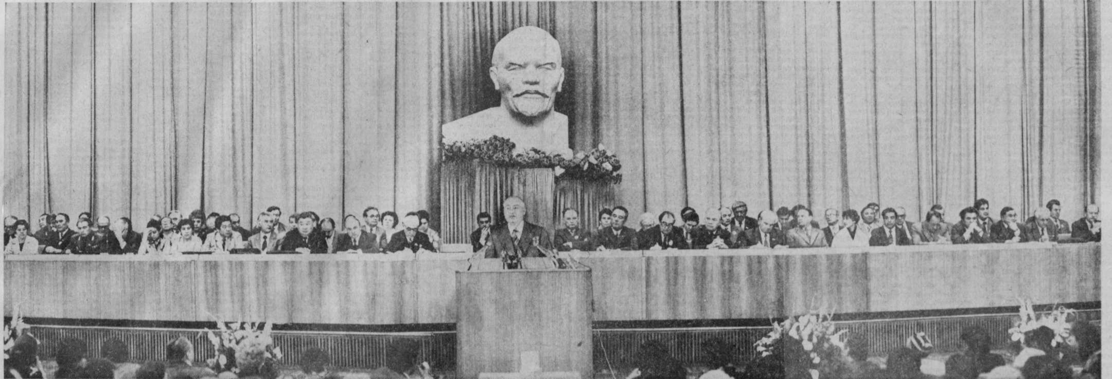
ТАШКЕНТ, 22 мая. На Всесоюзной научно-теоретической конференции.