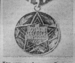
Как уже сообщалось, Президиум Верховного Совета СССР учредил медаль «За укрепление боевого содружества». Ею награждаются военнослужащие, работники органов государственной безопасности, внутренних дел и другие граждане государств — участников Варшавского Договора, а также других социалистических и иных дружественных государств за заслуги в укреплении боевого содружества и военного сотрудничества. На снимке: медаль «За укрепление боевого содружества».