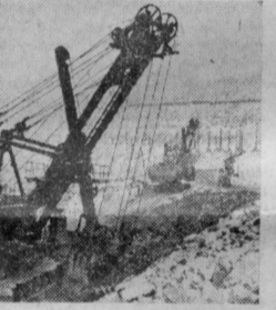
Добыча железной руды в угольном шахтском комбинате.