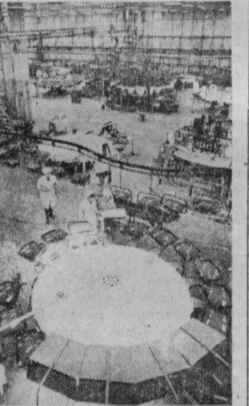
Многие киескопы, выпускаемые новгородским производственным объединением «ЭЛНОН», экспортируются в Венгерскую Народную Республику. Автоматические линии, контрольные приборы и стелды, штамповочные автоматы, работающие на «ЭЛНОН», изготовлены в ВНР. Самые крупные партнеры новгородцев являются венгерская фирма «Тунсрама». Все киескопы нового родского предприятия выпускает с государственным Знаком качества. На снимке: участок заирания киескопов.