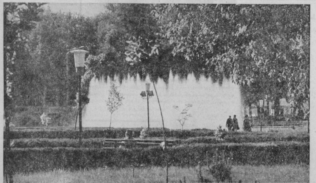
ТАШКЕНТ СЕГОДНЯ. На улице имени Карла Маркса.

Мы рады гостям, и стараемся сделать их пребывание в Ташкенте не только полезным, но и приятным.