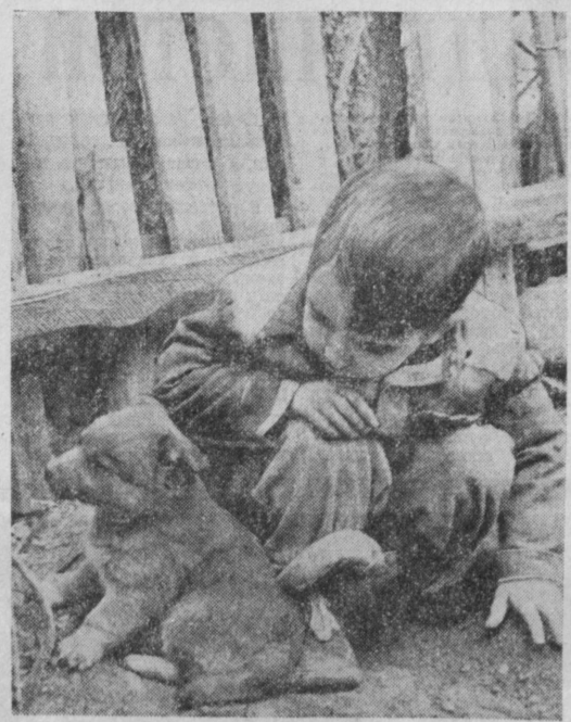
МЕЖДУНАРОДНЫЙ ГОД РЕБЕНКА. Наши читатели прислают в нынешнем году много снимков, рассказывающих о жизни детей Советского Узбекистана. Сегодня мы публикуем две фотографии, полученные редакцией на днях. Вверху — «Дружок! Ты на меня обиделся!»; внизу — музыкальные занятия в детском комбинате № 7 «Колобок» г. Наманган.

С. ЧИНАЕВ, фрезеровщик Ташкентского авиационного производственного объединения имени В. П. Чкалова.