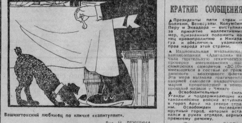
Вашингтонский любимец по кличке «капитулянт». Рис. Н. ЛЕУШИНА.

Президенты пяти стран — Боливии, Венесуэлы, Колумбии, Перу и Эквадора — выступили за принятие коллективных мер, призванных положить конец иррегулярности в Никарагуа и обеспечить уважение прав народа этой страны.