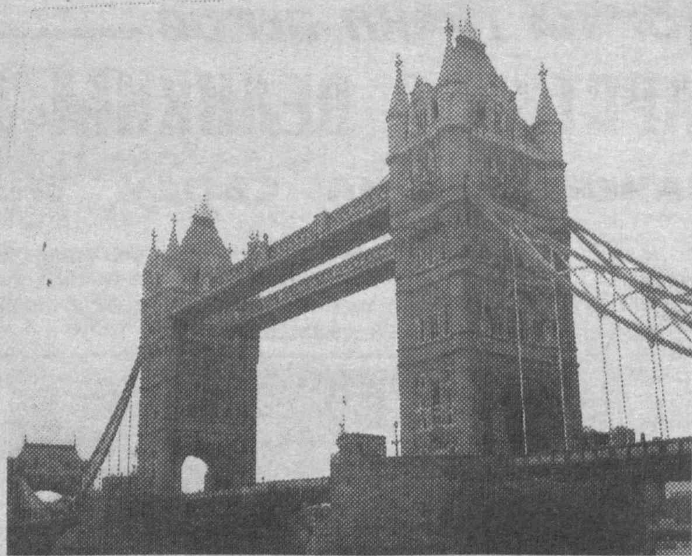
ПО СТРАНАМ МИРА. Англия. Лондон. Тауэрский мост.

На состоявшейся в Москве встрече глав правительств стран Содружества было решено провести в апреле конференцию по проблемам стратегического развития СНГ. Своё слово, несомненно, скажут и главы государств СНГ на намеченном на 19 марта в Москве саммите.