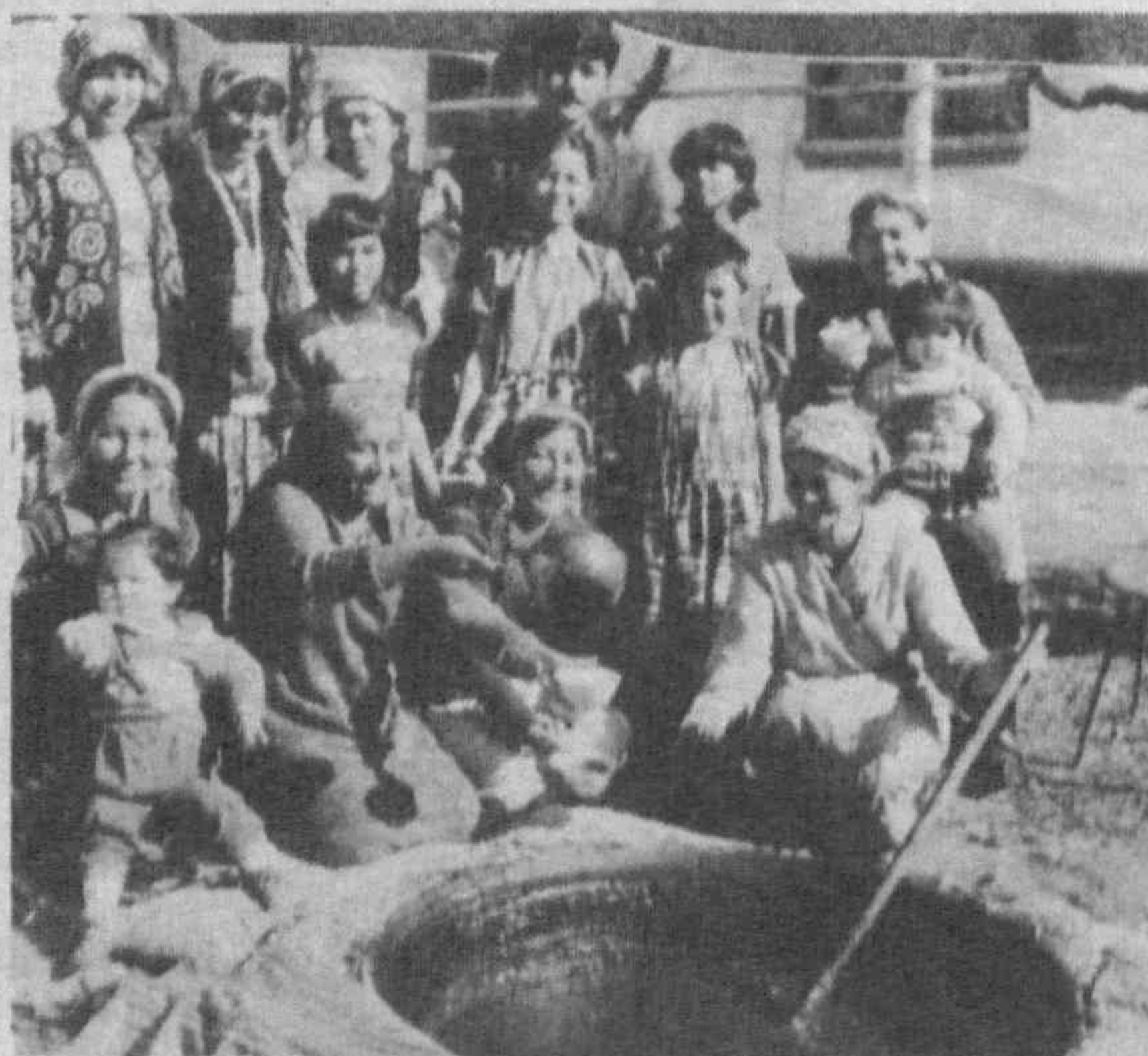
На снимке: варим сумальяк.