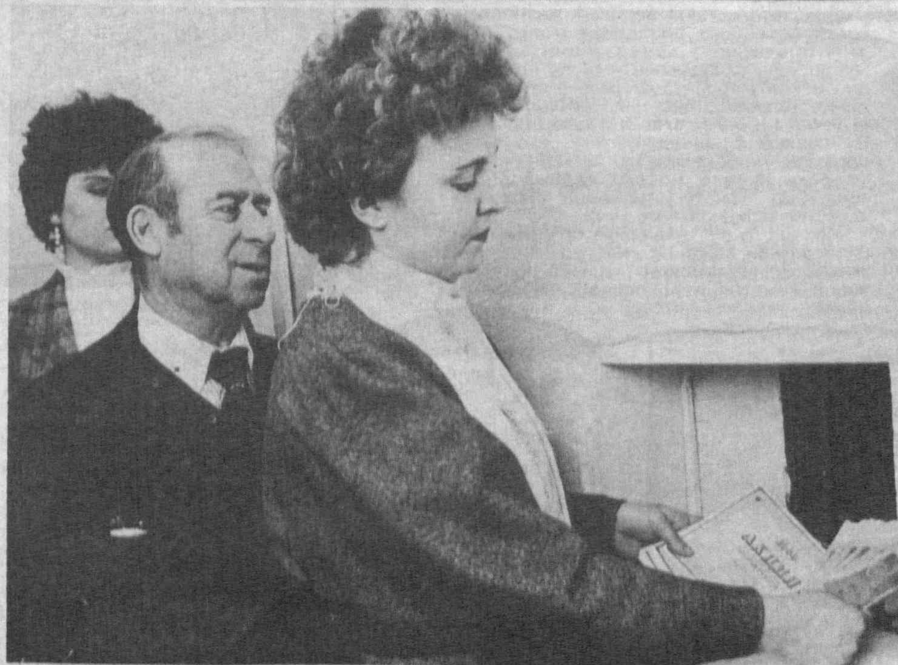
Реальная картина сегодняшнего дня: акционеры получают дивиденды.

нят целый ряд важнейших документов, которые заметно расширили законодательную базу предпринимательства, способствовали росту числа частных фирм, наполнению их работы новым, качественным содержанием.