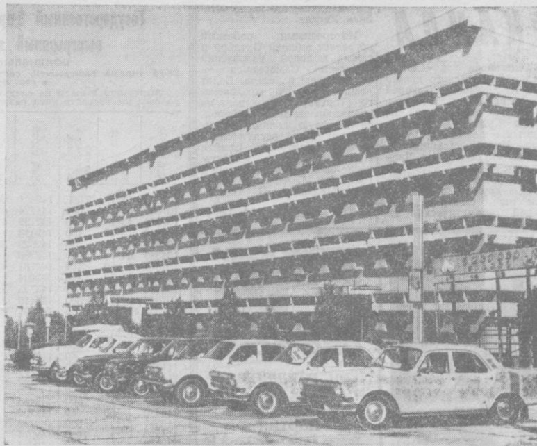
по ГОРОДАМ УЗБЕКИСТАНА. Карши. Административное здание, украсившее областной центр.

Наглядным показателем непрерывно растущего жи-