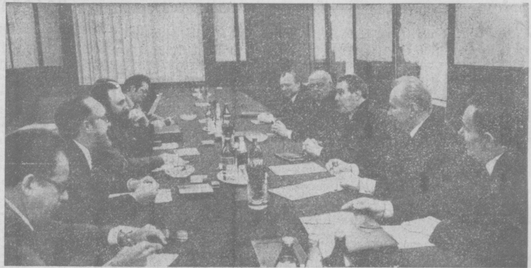
На снимке: во время беседы.