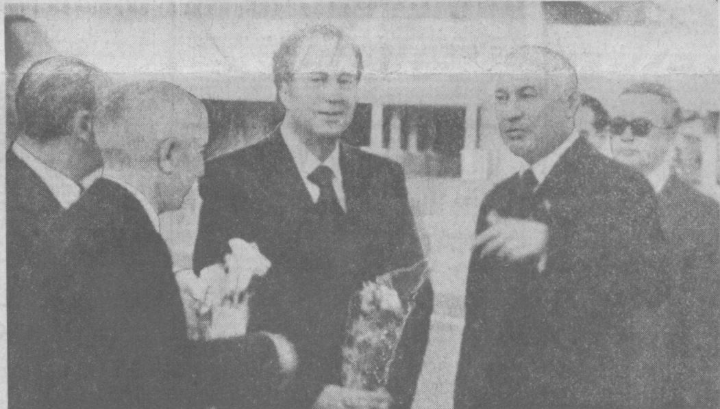
На снимке: кандидат в члены Политбюро ЦК КПСС, первый секретарь ЦК Коммунистической партии Узбекистана Ш. Р. Рашидов и Первый секретарь ЦК Коммунистической партии Уругвая Родней Арисменди во время встречи в Ташкентском аэропорту.