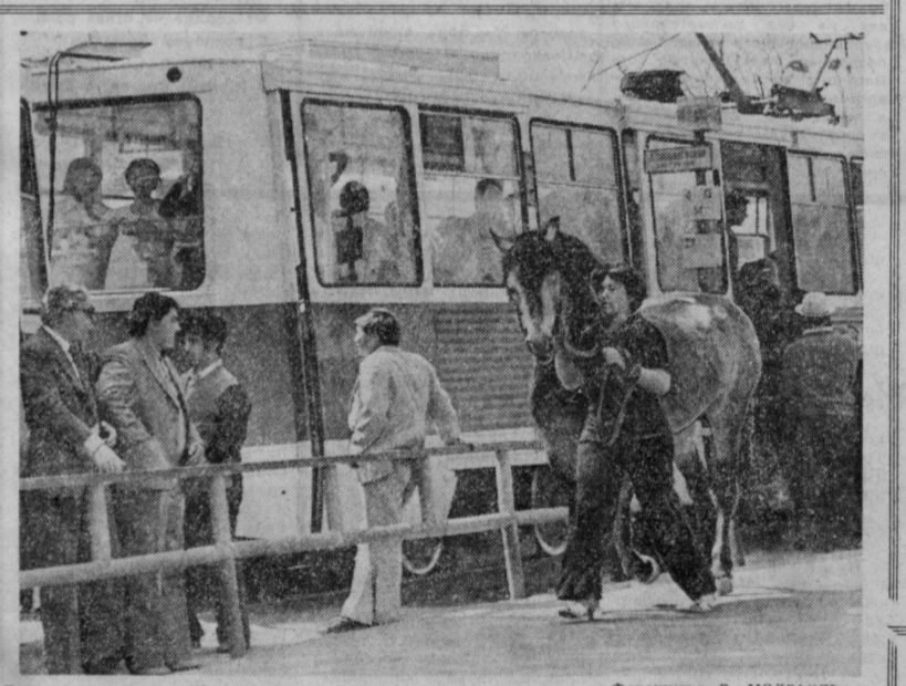
По улице коня водили...