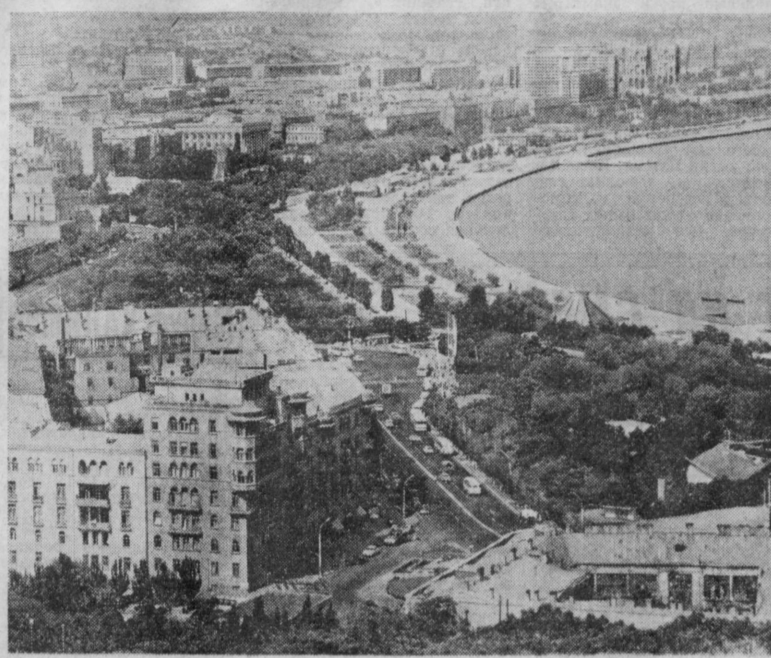
Столица Советского Азербайджана — город Баку. Вид на набережную.

Как неотъемлемая органическая часть многонациональной советской культуры развиваются и литература и искусство Узбекистана. Трудящиеся Азербайджана увидят лучшие достижения мастеров культуры нашей республики, смогут воочию убедиться, как щедро талантами земля Советского Узбекистана, расцветшая под солнцем Великого Октября.