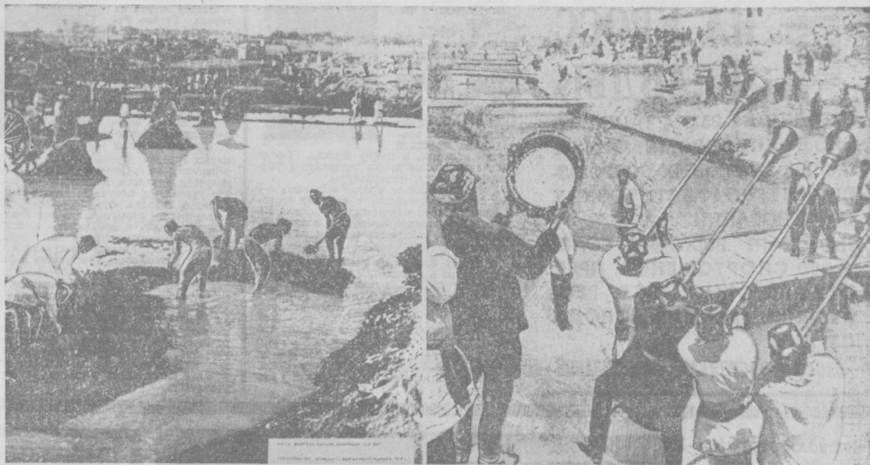
Строительство Большого Ферганского канала.

Газета отмечала не только хозяйственное, но и оборонное значение нового предприятия. Война стояла у нашего порога. «Мы не знаем, когда будем драться: завтра или послезавтра, а при таких условиях нужно быть готовым сегодня», — говорил в своем выступлении 5 июня 1941 года М. И. Калинин. И советский народ готовился.