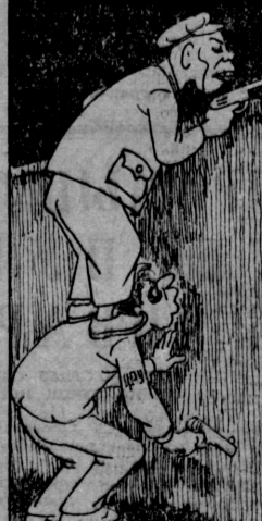
Пообратились... Рис. Н. ЛЕУШИНА.

А Согласно сообщением печати, с 1961 года во Франции закрылось 35 учебных заведений, а число шахтеров сократилось почти в 4 раза.