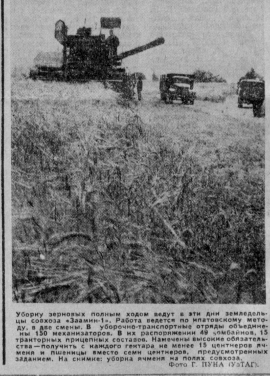
Уборку зерновых машинным ходом ведут в эти дни земледельцы совхоза «Замин». Работа ведется по иппатовскому методу, в две смены. В уборочно-транспортные отряды объединены 130 механизаторов. В их распоряжении 48 комбайнов, 15 тракторных прицепных с/двигателей. Намечены высокие обязательства — получить с каждого гектара не менее 15 центнеров зерна и пшеницы вместо семи центнеров, предусмотренных заданием. На снимке: уборка ячменя на полях совхоза.

дружбой с Советским Союзом, сказал Блас Рока. Братское сотрудничество двух партий, стран и народов основано на испытанных принципах марксизма-ленинизма, на общности интересов и целей. Говоря об успехах трудящихся Кубы в выполнении первого пятилетнего плана, направленного на создание материально-технической базы социализма, глава делегации заявил, что в этом большую роль сыграло тесное сотрудничество с Советским Союзом, широкое использование опыта СССР в коммунистическом строительстве. Во время сердечной, дружеской беседы была дана высокая оценка миролюбивой внешней политике Советского государства, подчеркнута важность инициатив, направленных на упрочение разрядки, обеспечение мира и безопасности народов. В этой связи было особо отмечено большое значение предстоящей встречи товарища Л. И. Брежнев с президентом США в Вене и заключения договора об ограничении стратегических вооружений. (ТАСС).