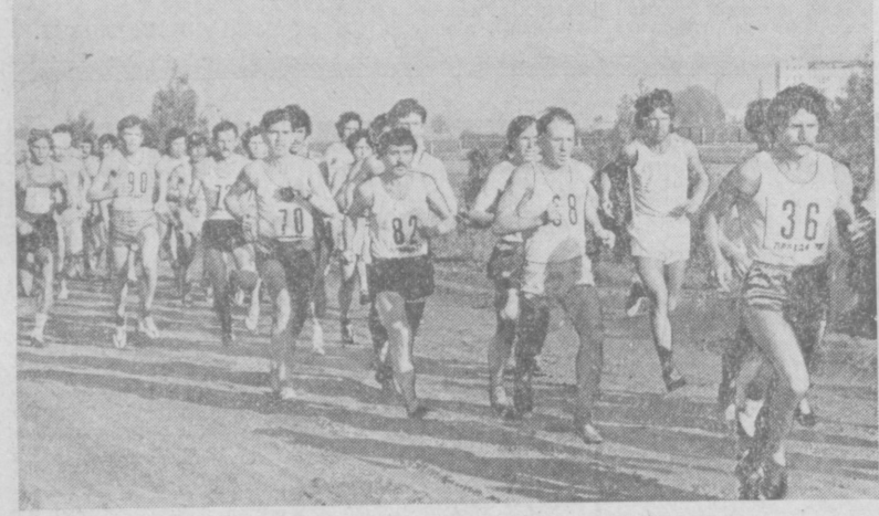
Забег на четырнадцать километров по праву считается одной из самых интересных кроссовых дистанций. Здесь для победы необходима и специальная подготовка, и воля к победе, и четкая тактика. На снимках: слева — спортсмены на старте; справа — парад-открытие финала XVI Всесоюзного кросса на призы газеты «Правда».