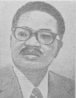
А. Агостино НЕТО.