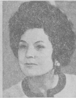
Ортелиус Бусси де АЛЬЕНДЕ.