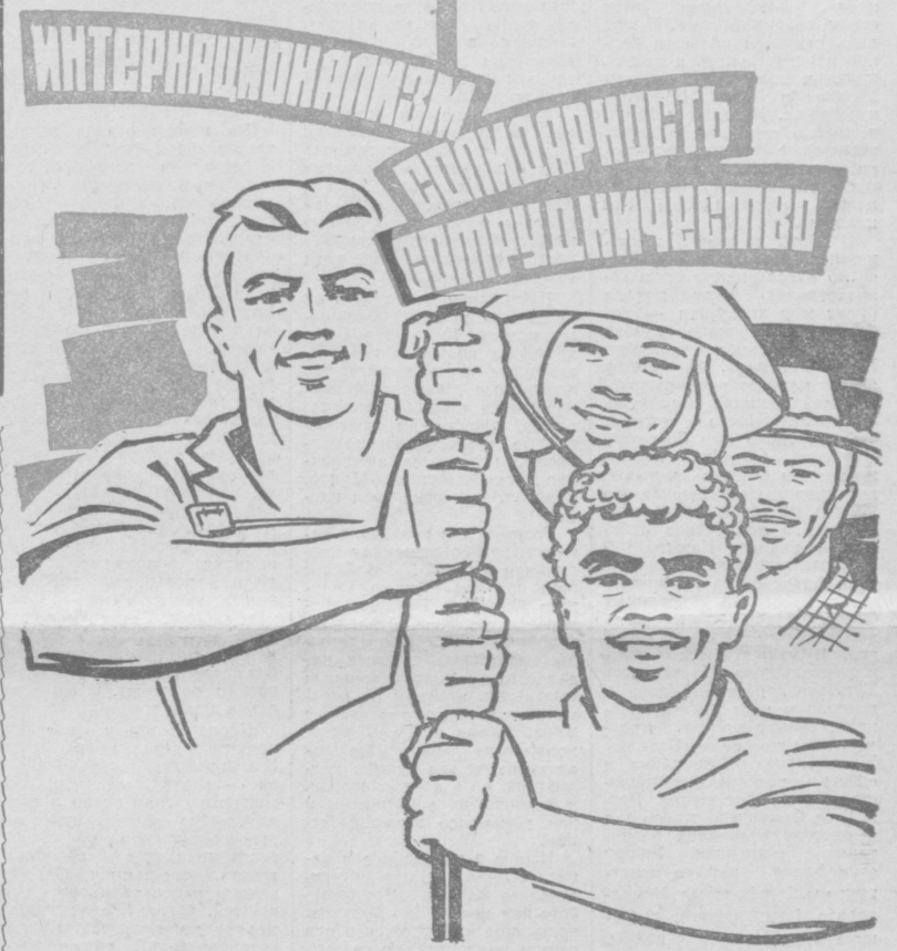
Рис. худ. В. ЕВЕНКО.