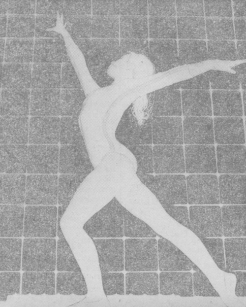
ЮНОСТЬ ДЕРЗАЕТ. (В зале Ферганской детской спортивной школы).

ВЕРХНЕОЛЫНКС. (Соб. корр.). Строительство самого большого в Ворошиловском районе кинотеатра завершено в районном центре. Привлечены новые инноваторы, что к зимнему залу, рассчитанному на 400 мест, примыкает летний зал на 300 мест, а пока фильм будет проигрываться из одной будки.