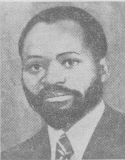
Самора М. МАШЕЛ.