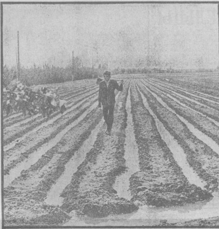
Антимо борются за высокий урожай юбилейного года хлопкоробы колхоза имени XXV партсъезда Бенабадского района. Уже более 80 процентов посеянной площади поито. Сейчас эта работа ведется в бригаде Ш. Ахмедова, которая стремится вырастить 80-центнерный урожай.

Шелководы посвящают свой труд славному юбилею Великого Октября.