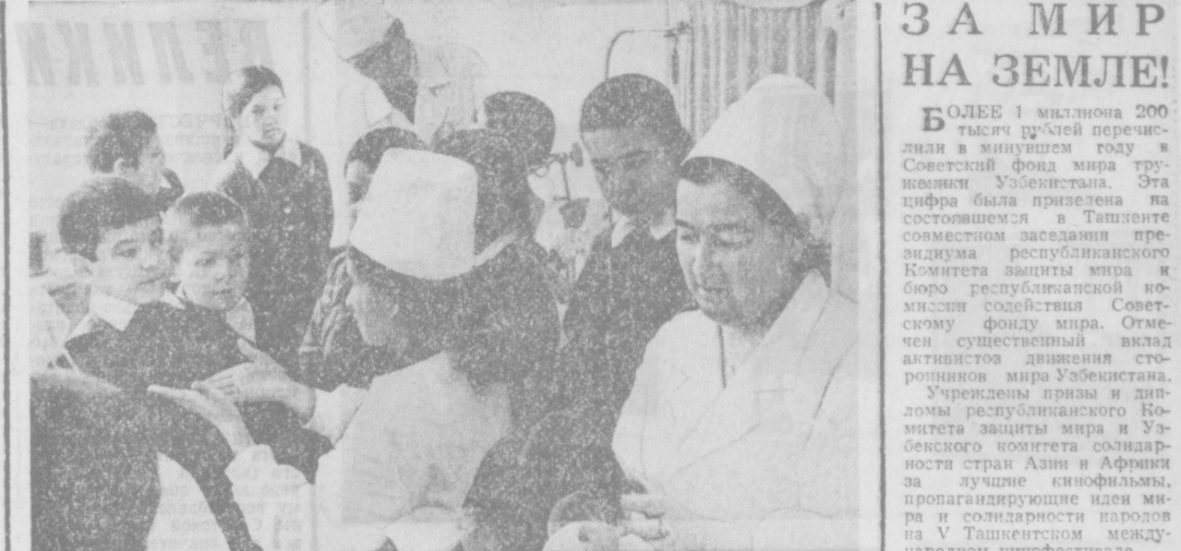
Работники здравоохранения Калининского района большое внимание уделяют охране здоровья школьников, ведут контроль за их физическим развитием. Здесь создана специальная бригада, состоящая из врачей-педиатров различных специальностей, которая регулярно осуществляет медицинские осмотры детей. В школе проводятся лекции и беседы на темы санитарии и гигиены. На снимке — врач-педиатр средней школы колхоза имени XX партсъезда.

Социалистические обязательства обречены и приняты коллективами предприятий и организаций, собраниями партийно-хозяйственного актива Каракалпакской АССР и областей, на расширенных заседаниях исполкома министерства торговли, бытового обслуживания населения, Главснаба Узбекской ССР и правления Узбеклягу.