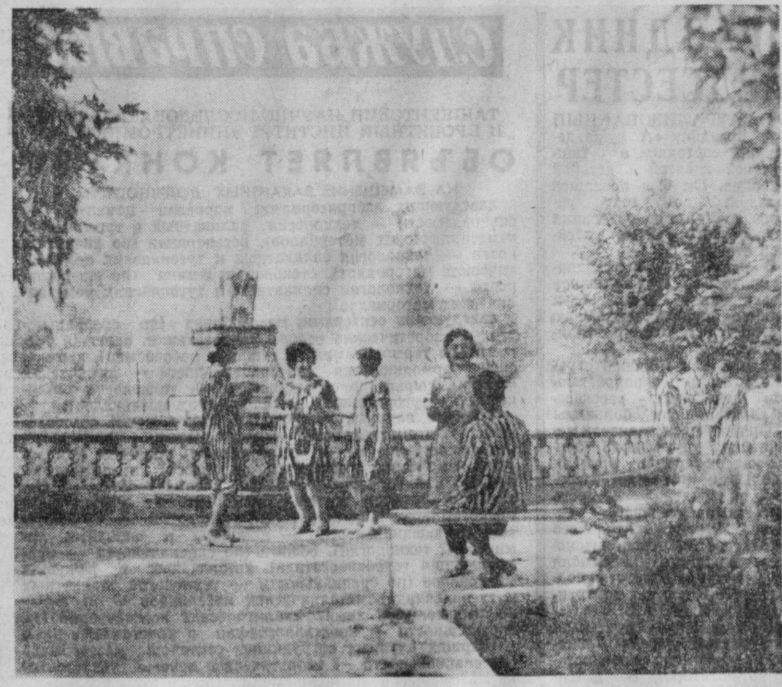
С каждым годом хорошеет и благоустраивается районный центр Туркунгар. На этом снимке вы видите один из уголков зоны отдыха.