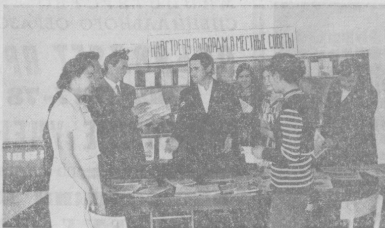
В Нукусском государственном университете создан избирательный участок № 22. Здесь уже началась активная подготовка и агитаторы — преподаватели и студенты университета — проводят встречи с избирателями, рассказывают им о правах и обязанностях избирателей, о работе местных Советов. На снимке: встреча с избирателями на участке № 22.

основная борьба за пятидесятилетний урожай уже впереди. И агитатор призывает людей использовать каждую минуту рабочего времени, беречь воду и материальные ресурсы. В перерывах хозяйства во всех бригадах построены типовые полевые станы. В дни избирательной кампании они стали центрами массово-политической работы. К. НАЗАРОВ.