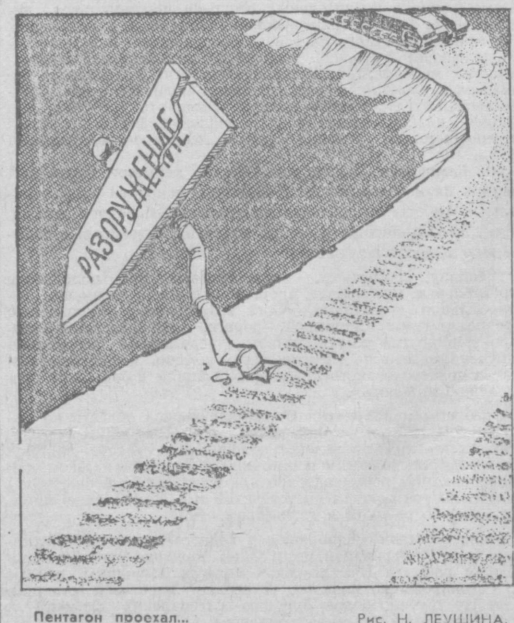
Пентагон прохал... Рис. Н. ЛЕУШИНА.

Обе стороны считают эти переговоры конструктивными и полезными и договорились продолжить их через две недели.