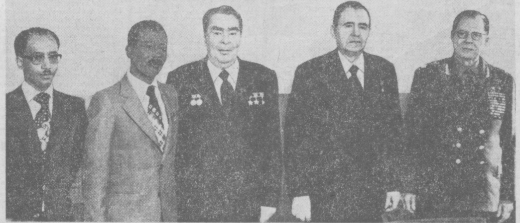
Перед началом беседы.

Встреча прошла в теплой, дружественной обстановке. (ТАСС).