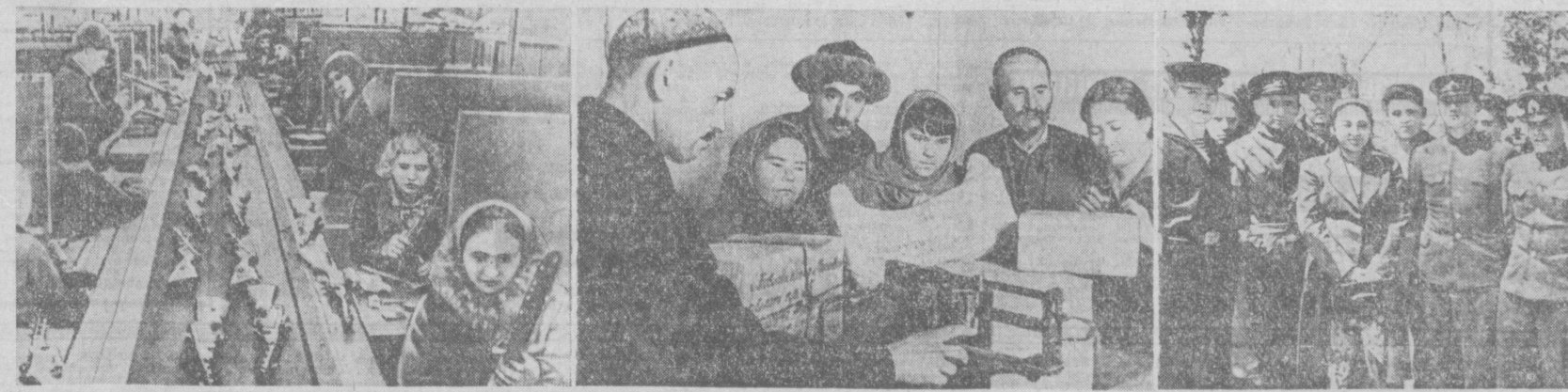
Эти снимки сделаны в годы войны, они — сама история. Слева направо: конвейер на заводе; посланцы — на фронт; Тамара Ханум среди фронтовиков после концерта. (Из экспозиции Музея дружбы народов).

Сельское хозяйство крепло и развивалось. В 1948 году по валовому сбору хлопка и по