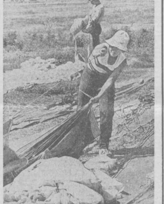
На тренировочные сборы парашютистов в Андижан прибыли спортсмены Российской Федерации, Украины, Белоруссии, Узбекистана. Среди них — участники международных соревнований, чемпионы Советского Союза, рекордсмены мира.

АНДИЖАН. (Общ. корр., М. Толочко). Огромные изменения произошли в области за годы Советской власти. Если до революции здесь было всего 29 школ и в них обучалось 900 человек, то сейчас их свыше 500 с контингентом учащихся 333 тысячи человек. С 70 до 18 тысяч увеличилось число преподавателей. Действуют четыре вуза и один филиал института. Имеется 595 библиотек, 313 клубов, 280 народных университетов, 41 дом культуры, 385 клубостановки. За каждый из этих цифр — неустанная работа партии и правительства о народном благе, о развитии культуры.