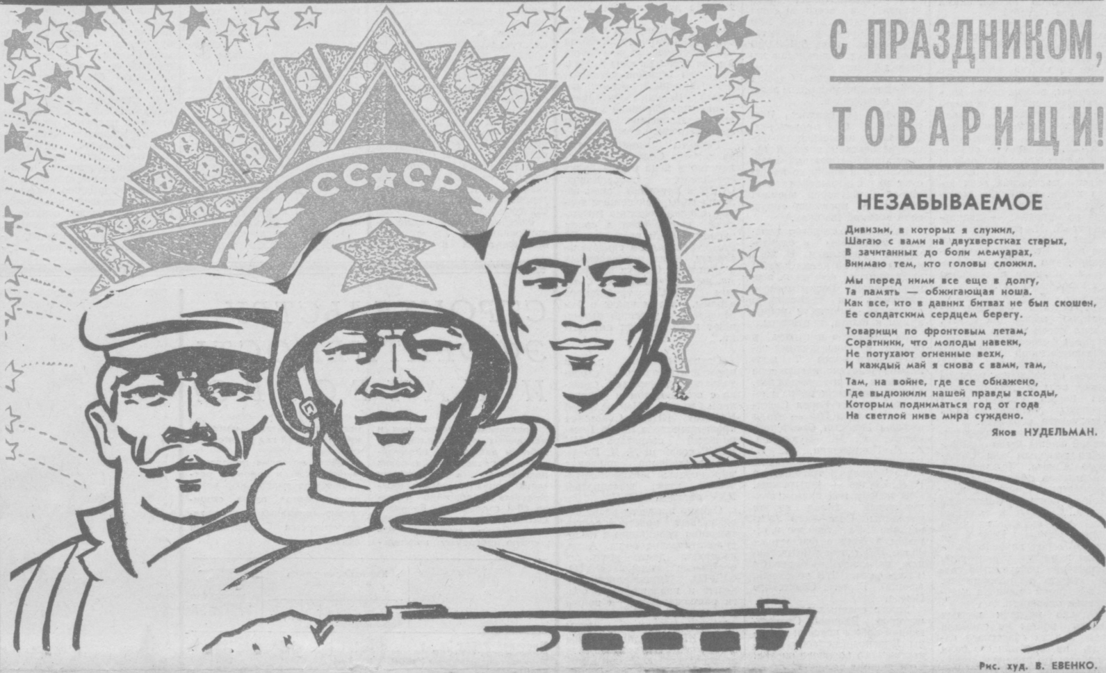
Рис. худ. В. ЕВЕНКО.

Вот уже тридцать два года сияет мирное небо над нами. Мы выращиваем небывалые урожаи хлеба и хлопка, строим новые города, возводим новые промышленные гиганты, оживляем пустыни, там, где не ступала нога человека, прокладываем новые трассы жизни, штурмуем космос. Вооруженные боевой техникой XXV съезда партии, мы идем от победы к победе в созидательной мирной труде. Боремся за то, чтобы навсегда исключить войну из жизни человечества. Мы мирные люди, но, как поется в песне, наш бронепоезд стоит на запасном пути. Потому, что мы помним и 22 июня, и 9 мая, помним все, что свершилось между этими датами. И память эту пронесем через всю свою жизнь, напомним об этом детям, внукам и правнукам нашим.