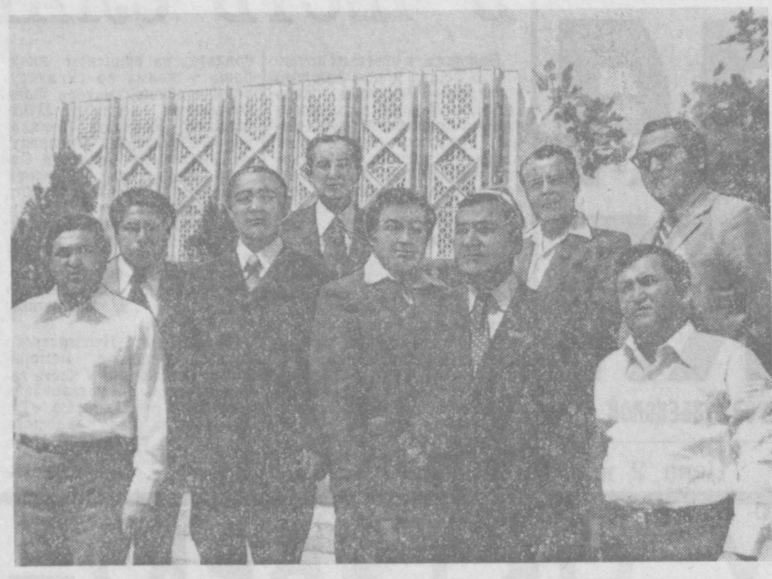
С ОФИЦИАЛЬНЫМ ДРУЖЕСТВЕННЫМ ВИЗИТОМ