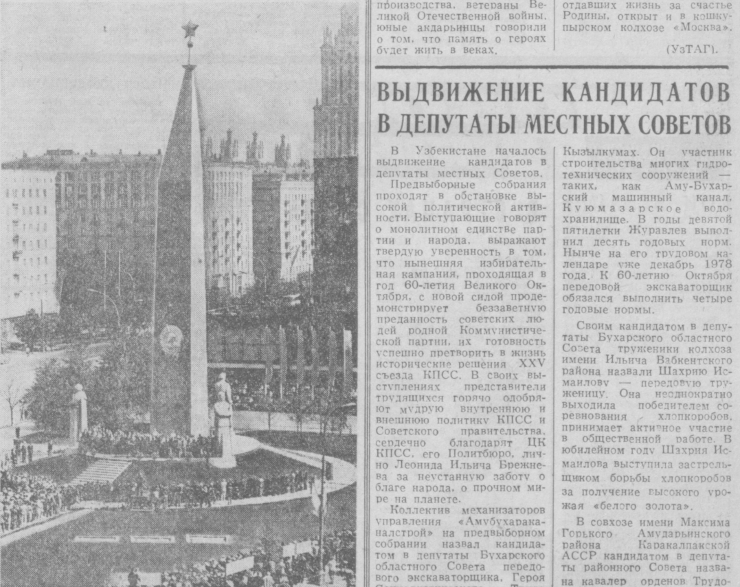
В Москве, на Кутузковском проспекте, 9 мая был торжественно открыт обелиск в честь города-героя Москвы. На снимке: во время открытия обелиска.

Участники митинга возложили к обелиску цветы.