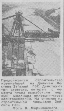
Продолжается строительство крупнейшей на Дальнем Востоке Зейской ГЭС. Действуют три агрегата, которые с момента пуска выработали первый миллиард киловатт-часов электроэнергии. На снимке: на строительной площадке Зейской ГЭС.

ТАЛЛИН . В столицу Эстонии пришла, наконец, весна, а вместе с ней наступил и месячник охраны природы. Коллективы предприятий, учреждений и школ города, сообщая председателю комиссии горсовета по охране окружающей среды Ю. Рейнколу, посадили в зеленой зоне столицы республики около 250 тысяч новых лесов. В течение месячника в кинотеатрах будут демонстрироваться кинофильмы, посвященные охране окружающей среды, пройдут тематические вечера. Традиция месячников охраны природы зародилась в Таллине два года назад.