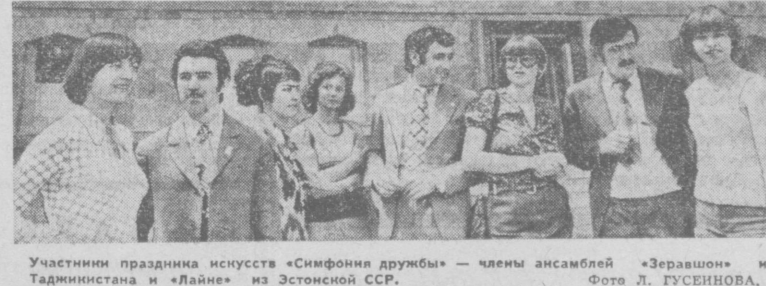
Участники праздника искусств «Симфония дружбы» — члены ансамбля «Зервшон» из Таджикистана и «Лайне» из Эстонской ССР.

Мы, целинники Голодной степи, особенно рады празднику искусств «Симфония дружбы» в Узбекистане. Наш пустынный в прошлом край оживает вся Советская страна. На целине создано более сорока совхозов, которые стали крупными производителями хлопка и другой сельскохозяйственной продукции. Представители более 70 национальностей рука об руку, словно родные братья и сестры, трудятся, осваивая новые земли.