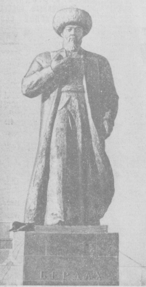
Памятник классике каракалпакской литературы поэту Берду, открытый недавно в Нукусе.

КИНО ДВОРЕЦ ИСКУССТВ: Карпаты, Карпаты... (большой зал), в 19.00 (малый зал, днем и вечером): Схватка в пурге; «КАЗАН-СТАН» (11, 12, 13, 14, 15, 19, 21.00); «НУКУС» (11, 13, 15, 17, 19, 21.00); «ДРУЖБА» (12, 14, 16, 18, 20.00); им. 50-ЛЕТИЯ ТАШСОВЕТА (12, 14, 16, 18, 20.00); «ВОСТОК» (10, 12, 14, 16, 18, 19, 40, 21.00); «МОСКВА» (10, 12, 14, 16, 18, 20.00); «30 ЛЕТ КОМ-