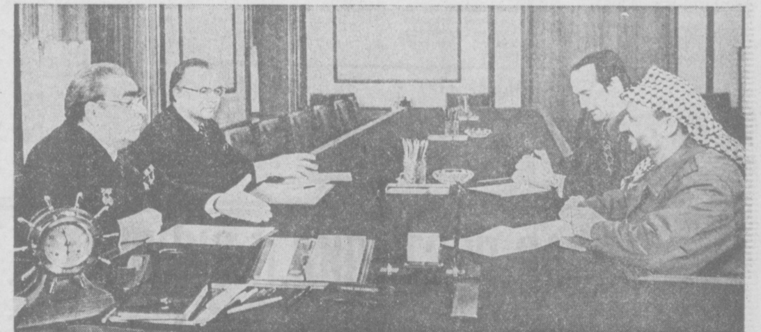
Во время беседы.

Проведение международных космических полетов является конкретным воплощением курса XXV съезда КПСС на всемерное расширение и углубление экономического и научно-технического сотрудничества с братскими социалистическими странами. (ТАСС)