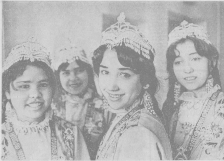
Еще один молодежный ансамбль родился в Самарканде при Доме культуры № 2. Его назвали «Согдиана». Участники ансамбля — рабочие, служащие, учащиеся профессионально-технических училищ. Все их объединяет любовь к песне, танцу. Сейчас коллектив ансамбля готовит большую концертную программу из песен и танцев народов Востока, с которой выступит перед трудящимися промышленных предприятий города. На снимке: группа девушек из ансамбля «Согдиана».