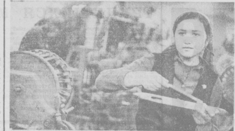
По-ударному трудится в третьем году пятилетки передовая ткачиха Названгановна Шеллох...