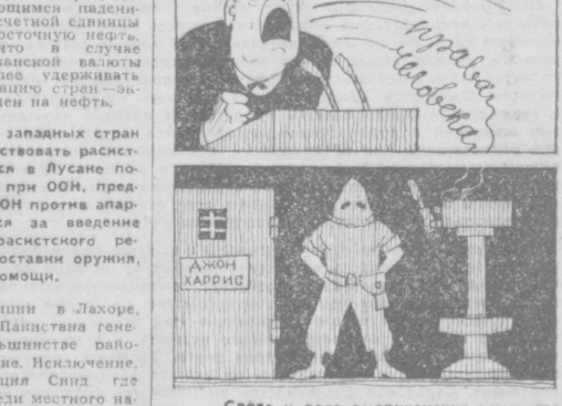
Слова и дела американских расистов. Рис. И. ТАБАЧНИКА.