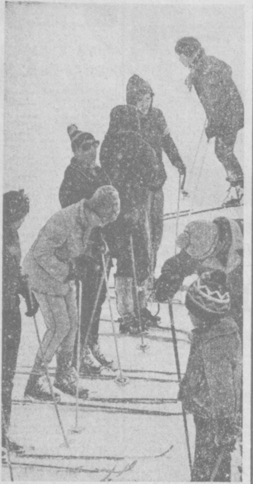
А на Чимгане еще зима...