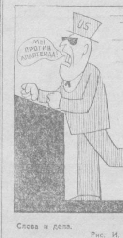
Слова и дела. Рис. И. ТАБАЧНИКА