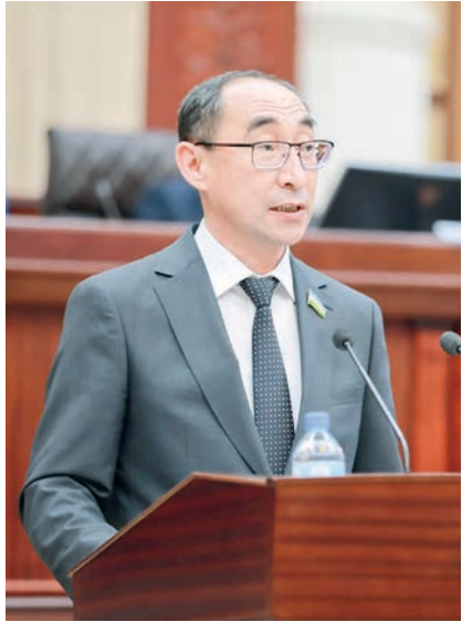
Тўлқинжон КАРИМОВ, Олий Мажлис Қонунчилик палатаси депутати, О'zLiDeP фракцияси аъзоси:

Бу ҳақда Олий Мажлис Қонунчилик палатасидаги Ўзбекистон Либерал-демократик партияси фракциясининг навбатдаги ййғилишида маълум қилинди.