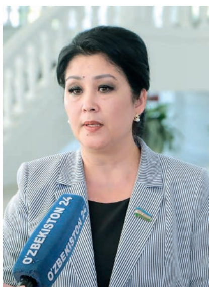
Нигора ҚУТЛИМУРОДОВА, Олий Мажлис Қонунчилик палатаси депутати, О'zLiDeP фракцияси аъзоси:

Қўшлган қиймат солиғи тўловчиси бўлган 1 056 та чорвачилик субъектларига – ўз хўжаликларидида етиштириб, реализация қилган гўшт, сўт, парранда гўшти, тухум ва балиқ маҳсулотларига давлат бюджетидан 234,9 млрд. сўм субсидия ажратилган.