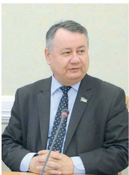
Шухрат БАФАЕВ, Олий Мажлис Қонунчилик палатаси депутати, О'zLiDeP фракцияси аъзоси:

Иқтисодиётга амалга оширилган харажатлар 2022 йилнинг биринчи ярим йиллигида 13 491,3 млрд. сўмни, ўз навбатида, ҳисобот давридаги жами давлат бюджети харажатларининг 13,1 фоизини ташкил этди.