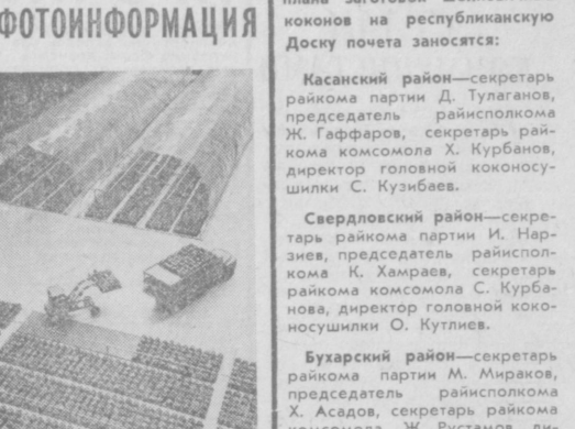
В павильоне «Лесная промышленность» на ВДНХ СССР открыта новая тематическая выставка «Создание постоянной лесосеменной базы на селекционной основе». В экспозиции представлены новые приборы и установки для выращивания посадочного материала, показывается механизация основных процессов производства лесных культур. На выставке представлены материалы «Брига» (манет) производственной мощностью 5 миллионов штук семян в год.