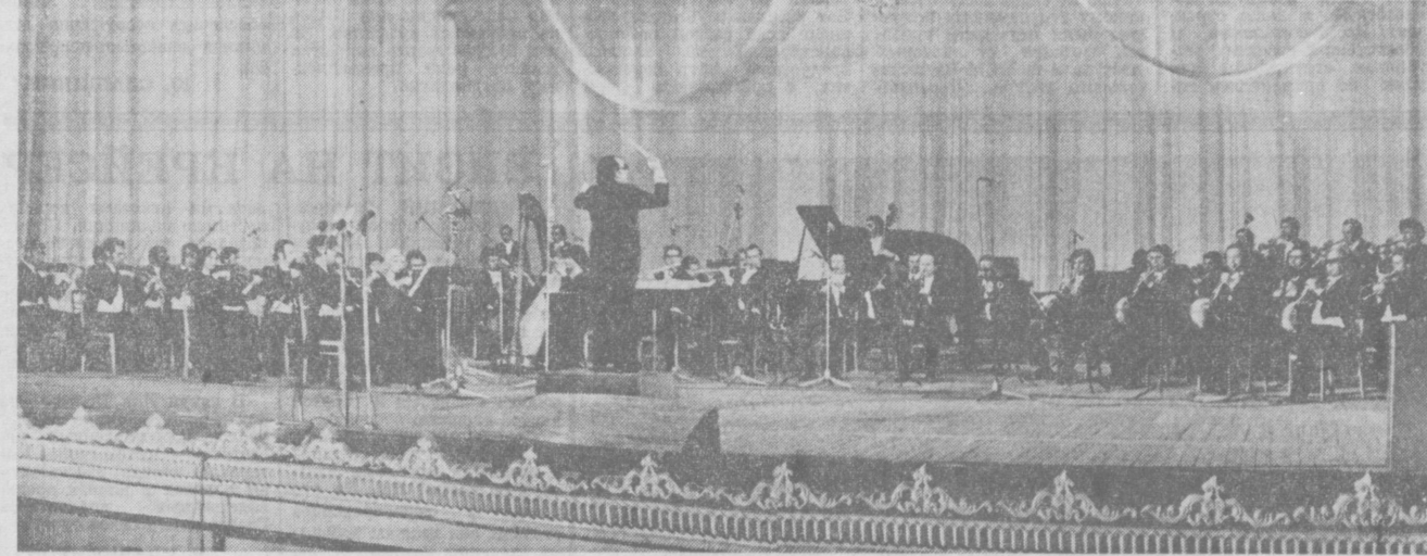
По Узбекистану шагает праздник искусств «Симфония дружбы». С большой теплотой, горлыми аплодисментами встречают трудящиеся нашей республики выступления артистов Морского флота СССР, многих союзных республик. Их концерты ярко демонстрируют нерушимую братскую дружбу народов нашей многонациональной Родины.