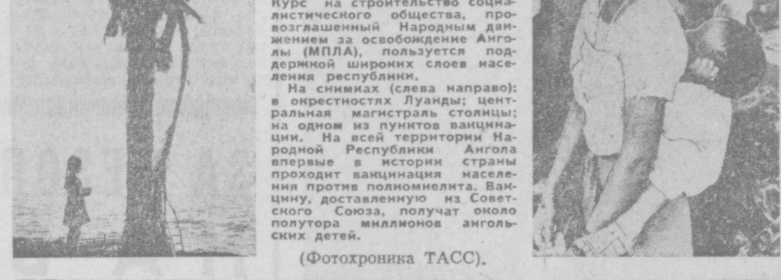
На снимках (слева направо): в окрестностях Луанды; центральная магистраль столицы; на одном из пунктов вакцинации. На всей территории Народной Республики Ангола широко проводится вакцинация населения против полиомиелита. Вакцины, доставленные из Советского Союза, получают около полумиллиона ангольских детей. (Фотохроника ТАСС).