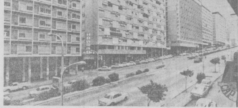
25 мая — День освобождения Африки. Это дата отмечается ежегодно, начиная с 1963 года, по решению Организации Африканского Единства (ОАЕ). 25 мая — праздник всей свободной Африки. — писала таганийская газета «Дейли Ньюс». — Это день, когда единая семья государств Черного континента подводит итоги борьбы против империализма, колониализма и расизма и намечает совместные действия по укреплению независимости и прогресса на будущее.

Огромное значение для освобождения Африки имело крушение самой старой и законной колониальной империи — португальской, что подвело историческую черту под эпохой прямого господства империалистической Европы над Африкой. Возникновение на