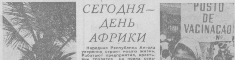
Народная Республика Ангола уверенно строит новую жизнь. Работают предприятия, растут урожаи, развивается собственное сельскохозяйственное производство. Большое внимание уделяется подготовке кадров, развитию науки и культуры. Народным движением за освобождение Анголы (МПЛА), пользуется поддержка широких слоев населения Республики.

«Даже задним числом страшно представить себе, что было бы дальше, каковой оказалась бы судьба миллионов казахов и киргизов, если бы не Октябрьская революция. Язык мой не повравняется сказать — возможно, нас и не было бы. А разве есть такой народ, который не хотел бы быть вечно?» — и потому только за одно это — за то, что Октябрьская революция, раздвинув в России, сокрушив империю колониализма и тем самым спасла наш народ от фатального истощения, я говорю: революцию до конца дней своих и детям детей своих завещаю: считать началом дней наших — Октябрь!»