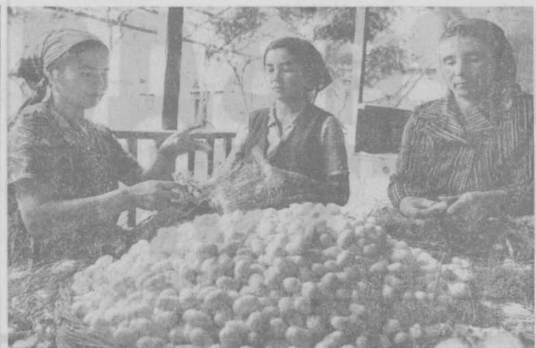
Шенковцы совхоза «Нарасу» Калининского района взяли в честь 60-летия Великого Октября высокие обязательства...