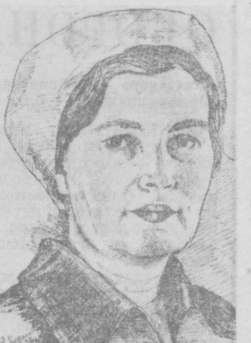
Рисунки ирисера Я. КОРОТКОВА.

В первую очередь надо сказать о Ферганском комбинате хлебопродуктов. Несмотря на наши претензии, он не снабжает нас мукой с нормированными показателями качества. Понятно, что и у него есть свои проблемы и трудности, и все же Министерству заготовок, в чьем ведении находится мельничное хозяйство, пора рассмотреть этот вопрос. Сохранение свежести и товарного вида хлебопродуктов издается во многом связано с условиями их перевозки, хранения и продажи.