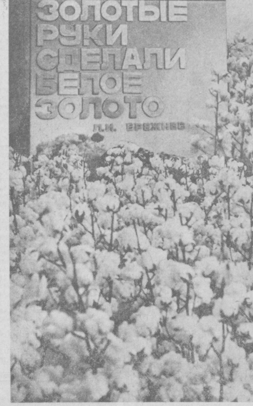
Посреди зала в павильоне Узбекской ССР на ВДНХ СССР — миниатюрное хлопковое поле, портрет Генерального секретаря ЦК КПСС Л. И. Брежнева и его замечательные слова о хлопководцах, которые золотыми руками делают «белое золото».

(Подробный рассказ о юбилейной экспозиции Узбекистана на Выставке достижений народного хозяйства СССР читайте на 2-й странице).