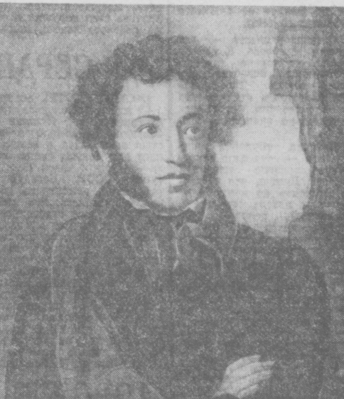
Александр Сергеевич Пушкин. С картины О. КИРПЕНСКОГО.

У памятника Пушкину в столице Узбекистана началась Пушкинская чтения. Поэты, студенты, рабочие, инженеры, солдаты, тысячи таинственных пришли на площадку поэта. И звучали у памятника стихи — на языке Пушкина и Назома, звучала творения великого сына земли российской и поэтические строки, созданные шпорам о своем бессмертном