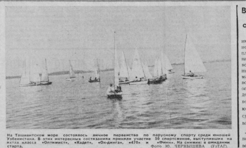
На Ташкентском море состоялось личное первенство по парусному спорту среди юношей Узбекистана. В этих интересных состязаниях приняли участие 50 спортсменов, выступивших на лодках класса «Оптимист», «Кадет», «Оп-двинга», «470» и «Фини».