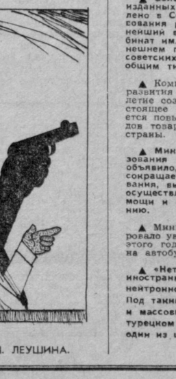
Тень марionетки.