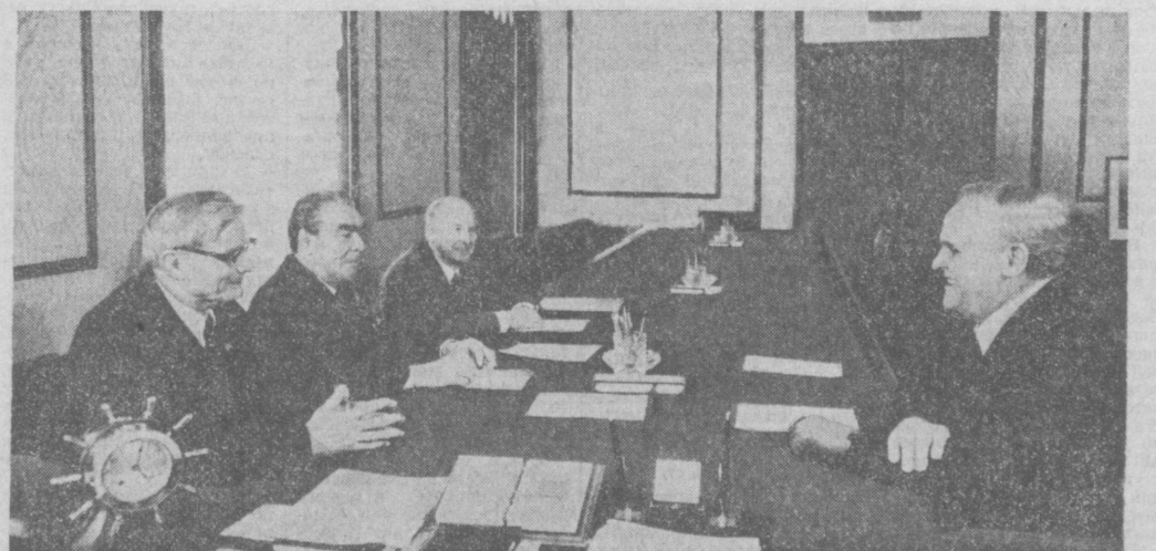
Во время встречи.

отношений между обеими партиями, основанных на принципах марксизма-ленинизма, пролетарского интернационализма. (ТАСС).