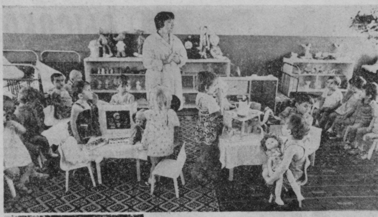
МЕЖДУНАРОДНЫЙ ГОД РЕБЕНКА