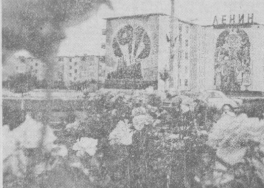
ПО ГОРОДАМ УЗБЕКИСТАНА. Карши. Новые дома на улице Ленина.

Эти крупнейшие соревнования горнолыжников среднеазиатских республик стали для них отменной школой для повышения мастерства и последние время привлекают пристальное внимание специалистов, тренеров.