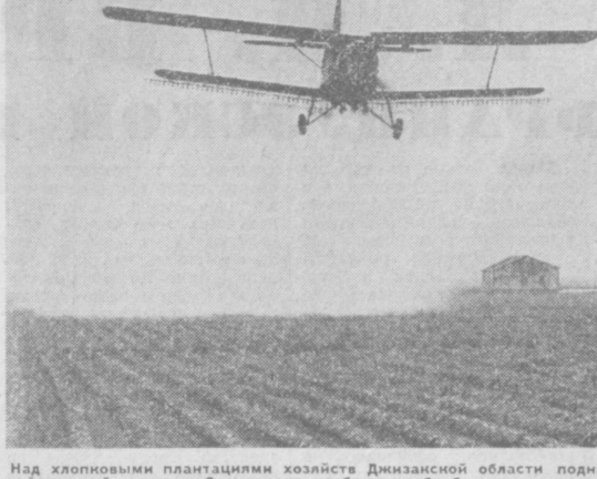
Над хлопковыми плантациями хозяйства Джиззакской области поднимались самолеты сельскохозяйственной авиации. Они вносят удобрения, обрабатывают посевы химикатами. На снимке: самолеты ведут борьбу с сельскохозяйственными вредителями на полях колхоза имени Навои Джиззакского района.

№ 138 (18415) Четверг, 16 июня 1977 года Цена 2 коп.