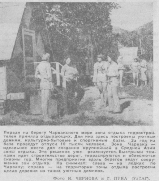
Первая на берегу Чарванского моря зона отдыха гидростроителей приняла отдыхающих. Для них здесь построены уютные домики, культурно-бытовые и спортивные базы.