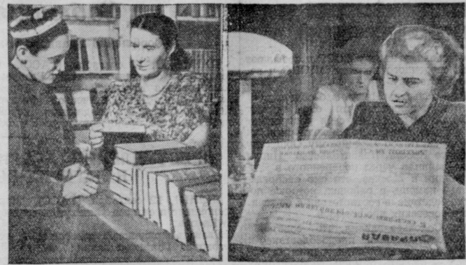
НА СТРОИТЕЛЬСТВЕ ГЛАВНОГО ТУРКМЕННОГО КАНАЛА

Гвардин генерал-лейтенант танковых войск.