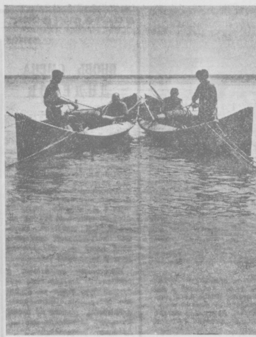
Рыбаки Арала, нан и все работники рыбной промышленности республики...