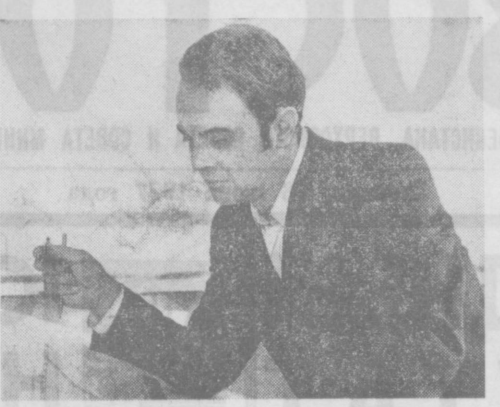
Трибуна передовика пятилетки