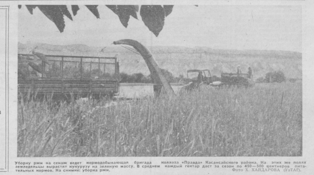
Уборку ржи на сенаж ведет нормодобывающая бригада колхоза «Правда» Касансайского района. На этих же полях земледельцы выращивают нурурузу на зеленую массу. В среднем каждый гектар даст за сезон по 450—500 центнеров питательных кормов. На снимке: уборка ржи.

Состоялось первое заседание правления Союза композиторов Узбекистана. Его председателем вновь избран Э. Ш. Салихов. Заместителями председатели правления избраны Б. Ф. Гнеюв, Н. Закиров. (УзТАГ).