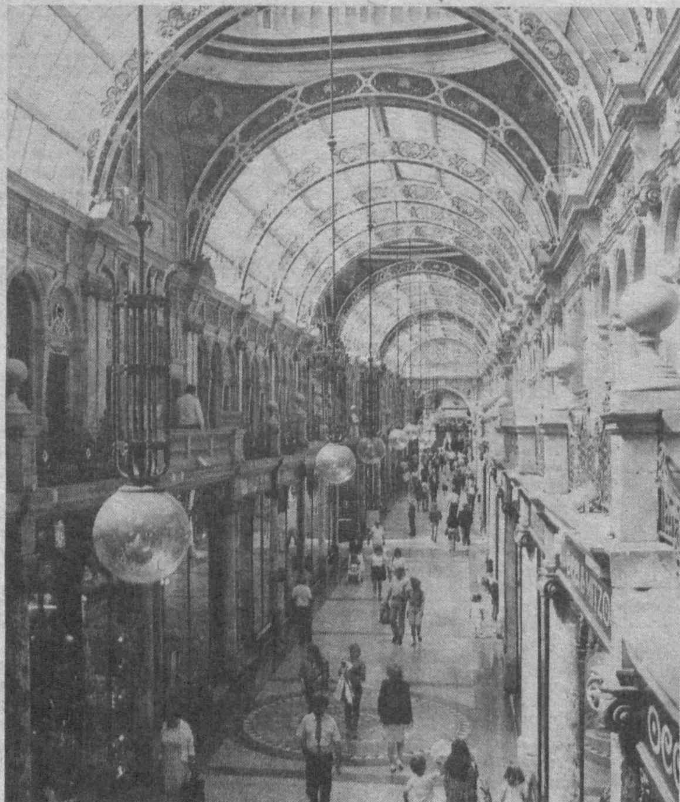
ПО СТРАНАМ МИРА. Англия. Город Лидз. Улица из стекла.

Число ограблений банков в Нью-Йорке, согласно данным правоохранительных органов, в прошлом году, когда было зафиксировано 235 нападений на банки, увеличилось по сравнению с предыдущим годом на 47 процентов.