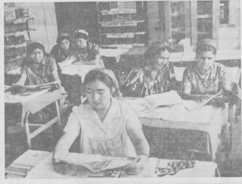
В поселке Учкунрик — центре Ленинградского района — большой популярностью пользуется центральная районная библиотека имени Пушкина. Здесь большой выбор разнообразной литературы. На снимке — читальный зал библиотеки.