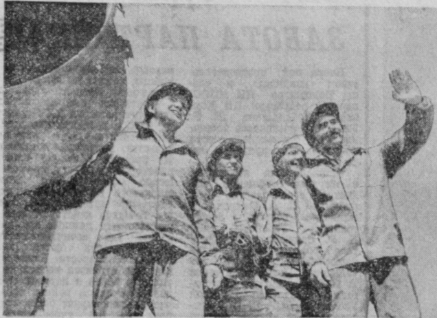
В Ташкенте на территории Кировского района идет сооружение башни радиостанции...