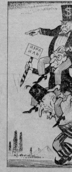
Сопративная египетская пирамида. Рис. Б. ЖУКОВА.

Египетское руководство спешит показать свою верность капиталистической системе с Израилем, добиваясь максимального распределения себя по сторонам руководящих кругов Вашингтона и Тель-Авива. (Из газет).