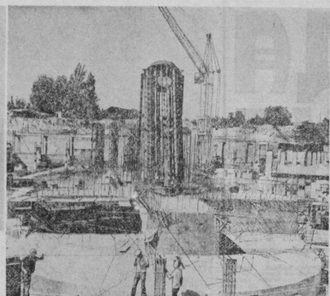
Строительство ведут подразделения треста № 11 «Высстрой» Главмонтажстроя...