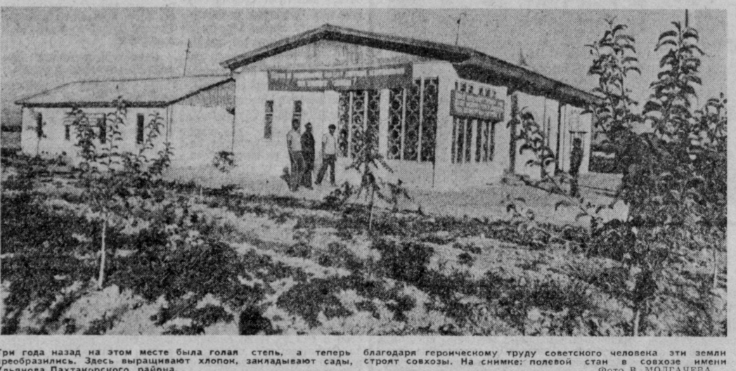
Три года назад на этом месте была голая степь, а теперь преобразилась. Дети вышивают хлопок, закладывают сады, строят совхозы. На снимке: полковая стан совхоза имени Ульянова Пхакторского района.

Секретарь Пхакторского райкома партии В. Пасюта сообщил, что это выступление послужило поводом для глубокого анализа положения дел на животноводческих фермах. На совещании работников животноводства с участием зоотехников, ветеринаров, руководителей хозяйств разработаны мероприятия, направленные на укрепление кормовой базы, улучшение племенной работы, широкую специализацию и механизацию ферм. В связи с этим созданы местные и отраслевые комплексы. Животноводческие бригады укреплены опытными специалистами. Кормодобытчики создают полугорючий запас кормов. Партийные организации усилили контроль за работой ферм, строго следят за выполнением повышенных обязательств по производству продукции животноводства.