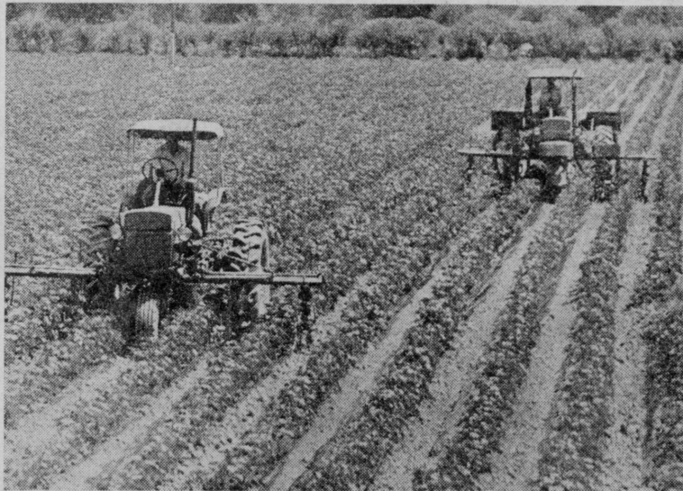
На тысяче гектаров раскинулись хлопковые поля колхоза «Октябрь» Московского района. Земледельцы приняли обязательство собрать с каждого из них по 40 центнеров хлопка. Сейчас идет обработка растений.

Заседание Совета Старейшин Верховного Совета Узбекской ССР состоится 24 июля 1979 года в 9 часов 30 минут утра в зале заседаний ЦК Компартии Узбекистана.