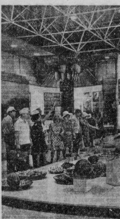
На снимках: центральное место на ВДНХ Узбекской ССР занимает павильон «Хлопководство Узбекистана» (вверху слева); иностранные туристы осматривают сельскохозяйственную технику, представленную на открытой площадке (внизу слева); посетители знакомятся с разделом садоводства, виноградарства и овощеводства (справа).

С. ПОЛЫНОВА. Общ. корр. «Правды Востока».