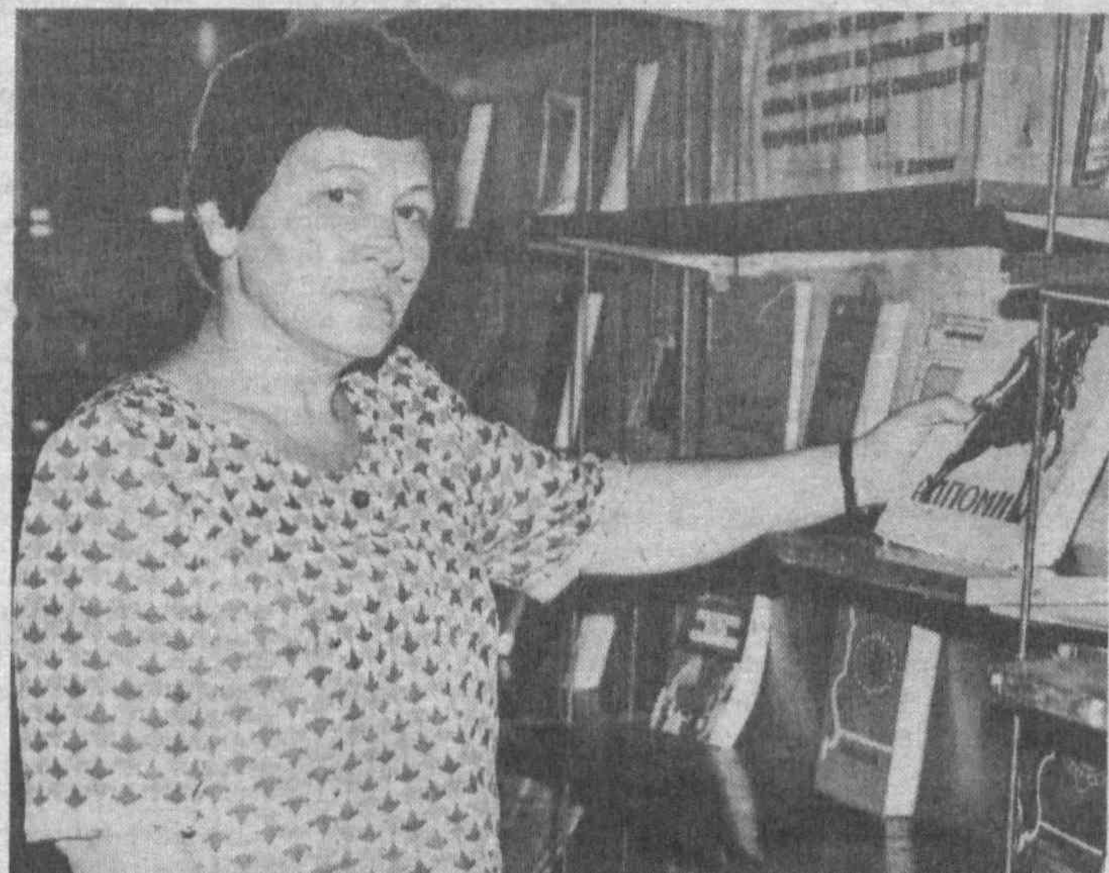
Книга в нашей жизни