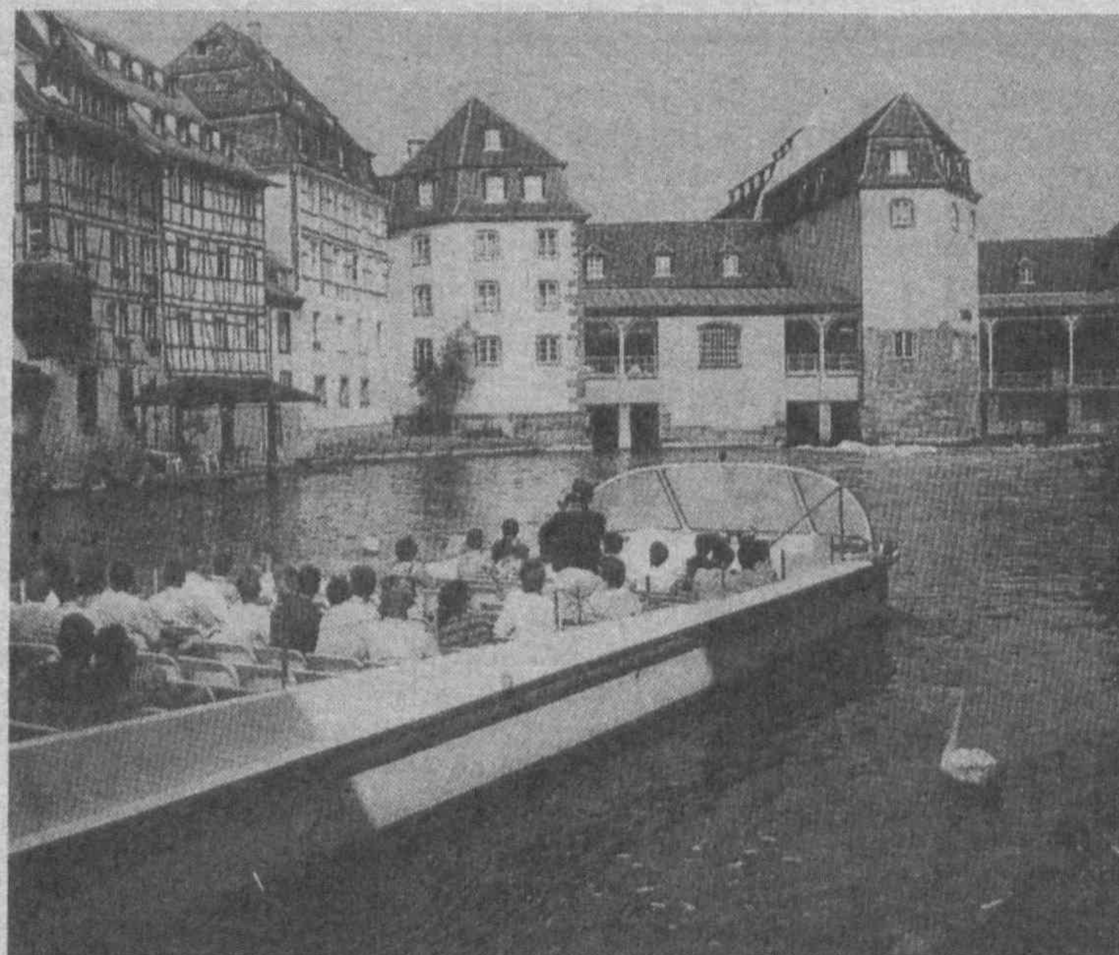
ПО СТРАНАМ МИРА. ФРАНЦИЯ. Квартал «Маленькая Франция» в Страсбурге.

Пакистан заявил о готовности в кратчайшие сроки возобновить с Индией переговоры на высшем уровне по всему спектру спорных вопросов, включая кашмирскую проблему.